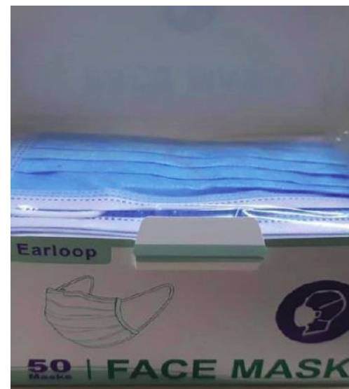
Le mascherine acquistate dal Comune

genti mettendo a rischio la propria salute, mentre ulteriori 300 mascherine del tipo Fftp2 saranno invece destinate ai volontari del Soccorso Bellanese». «Un ulteriore modo per manifestare la nostra vicinanza a tutti coloro che si stanno adoperando attivamente per far fronte all'emergenza», conclude Rusconi.