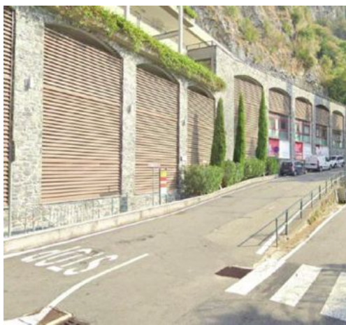
Il parcheggio multipiano di Viale Polvani