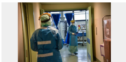
Camici, Dama ne offrì altri 200 mila