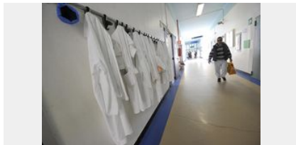
Camici Lombardia: non fu donazione