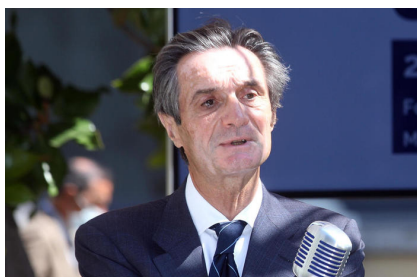
Caso camici Lombardia, indagato il cognato di Fontana. I magistrati: fornitura non donazione