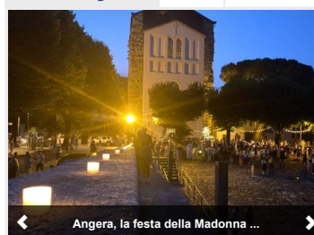
Angera, la festa della Madonna ...